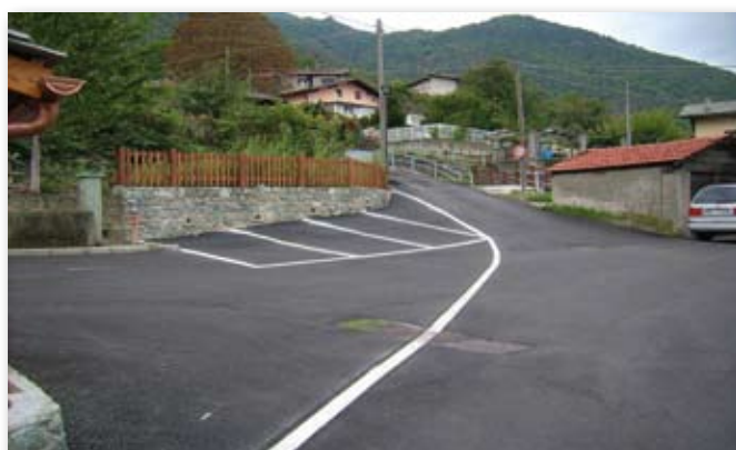
SISTEMAZIONE E AMPLIAMENTO DEL PIAZZALE PUBBLICO DI BANCHET (AREA NEGOZIO ALIMENTARI). Completamento definitivo con realizzazione di muro di contenimento della strada comunale previsto per l'anno in corso con fondi comunali stante l'esclusione del Comune operata da parte dell'Assessorato Opere Pubbliche di beneficiare delle squadre dei cantieri Regionali