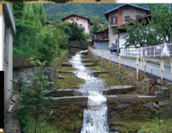
Pulizia Torrente Acque Nere