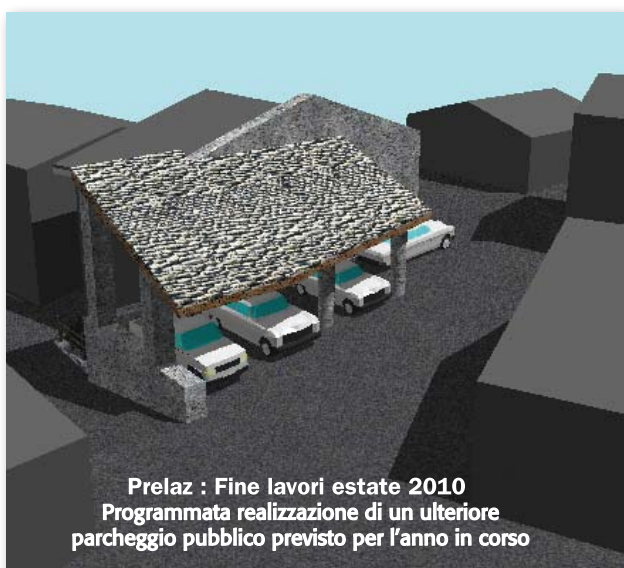
Prelaz : Fine lavori estate 2010 Programmata realizzazione di un ulteriore parcheggio pubblico previsto per l'anno in corso