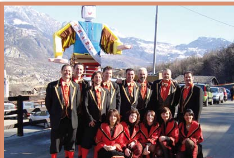
Foto comitato anno 2009

Il Comitato, avvalendosi anche del prezioso apporto di tanti volontari, ed inoltre della collaborazione dell'Oratorio, ha organizzato diverse iniziative concluse con la giornata del martedì grasso caratterizzata dall'aspetto enogastronomico, dallo spettacolo per i bambini, dalla lotteria e dal rogo del "Ferpafropa". Si ricorda che quest'anno ricorreva il 40 le della nascita del comitato.