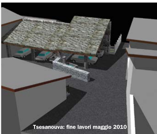
Tsesanouva: fine lavori maggio 2010