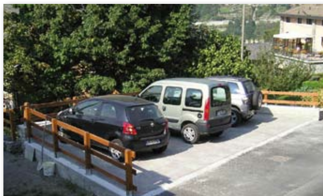
SISTEMAZIONE STRADA COMUNALE FRAZ. CLAPEY CON REALIZZAZIONE DI PARCHEGGIO PUBBLICO ED ILLUMINAZIONE.