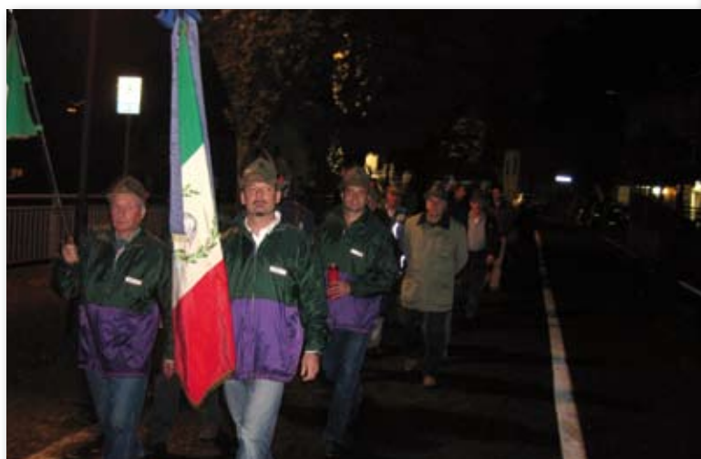
Commemorazione della fine della Prima guerra mondiale

Il Gruppo Alpini parteciperà all'adunata nazionale di Bergamo del 9 maggio.